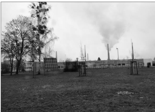
Schwedt an der Oder an einem Januarmorgen. Ein Schlot qualmt noch.

Nochmal Fritz in Washington: Falls die US-Plattform Bloomberg zutreffend berichtet, war der Kanzler beim Don, um von diesem die Aufhebung des Boykotts von Rosneft (Deutschland) zugesagt zu bekommen. In Klardeutsch: das Russenöl darf jetzt wieder Richtung Schwedt fließen. Wie es dahin kommen soll, ist mir noch nicht ganz klar. Ich habe in Erinnerung, dass 2023 die französischen Eigentümer den Ölhahn der Drushba-Pipeline (nördlicher Zweig) dichtgemacht haben. Bleibt die weitere Frage: bettelte Merz um die Wiederezulassung, oder musste er von Trump hierzu gedrängt werden, weil, wie die Bloomberg-Amerikaner fürchten, die deutsche Wirtschaft zu kollabieren droht?